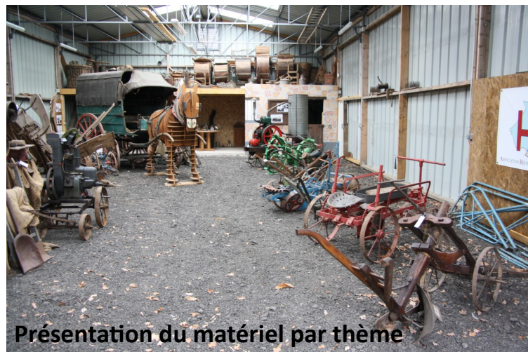
Présentation du matériel par thème