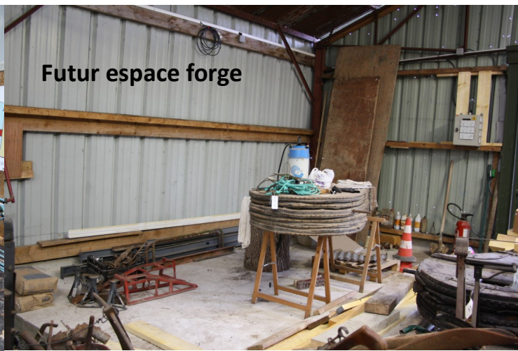
Futur espace forge