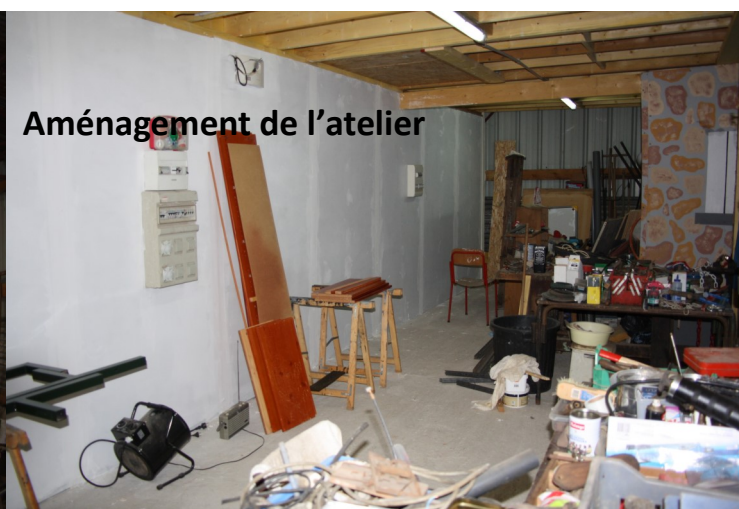
Aménagement de l'atelier