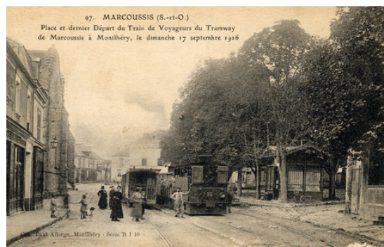
La gare de l'Arpajonnais et le train

Du 25 septembre au 6 octobre, nous allons retracer cette aventure de l'Arpajonnais qui a totalement changé le destin de Marcoussis.