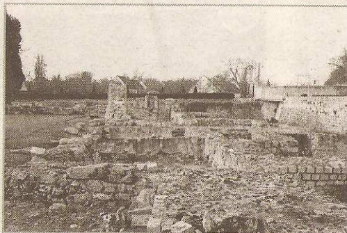
Ne reste principalement du château que des ruines.

En 1404, afin d'appuyer son pouvoir, Jean de Montagu, surintendant des finances de Charles VI et seigneur de Marcoussis, décide de faire construire un château fort, un monastère, celui des Célestins, ainsi qu'une église sur la commune. Une opération qui va durer 4 ans et qui va profondément modifier le caractère du site. Une entreprise d'envergure dont il ne pourra réellement en profiter : il sera décapité sous ordre du duc de Bourgogne en 1409.